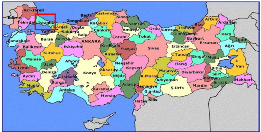
Harita 1 - İstanbul'un Konumu

İstanbul, Türkiye'nin en büyük kenti olup, yıllık %0 33.1 nüfus artışı ve 10 milyon kişiyi aşan nüfusu ile dünyanın da sayılı kentlerinden biri haline gelmiştir. Batı ile Doğu arasında köprü olma özelliği ile yerli ve yabancı sermaye için, bölgelerarası ilişki kurma ve bölgelere açılma yönünden önemli bir merkezdir. İstanbul Boğazı, Karadeniz'i, Marmara Denizi'yle birleştirirken; Asya Kıtası'yla Avrupa Kıtası'nı birbirinden ayırmakta ve İstanbul kentini de ikiye bölmektedir.