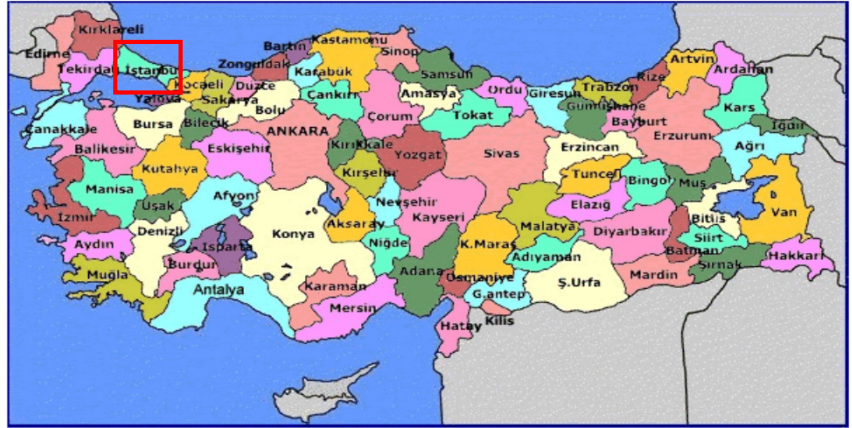
Harita 1 - İstanbul'un Konumu

İstanbul, Türkiye'nin en büyük kenti olup, yıllık %0 33.1 nüfus artışı ve 10 milyon kişiyi aşan nüfusu ile dünyanın da sayılı kentlerinden biri haline gelmiştir. Batı ile Doğu arasında köprü olma özelliği ile yerli ve yabancı sermaye için, bölgelerarası ilişki kurma ve bölgelere açılma yönünden önemli bir merkezdir. İstanbul Boğazı, Karadeniz'i, Marmara Denizi'yle birleştirirken; Asya Kıtası'yla Avrupa Kıtası'nı birbirinden ayırmakta ve İstanbul kentini de ikiye bölmektedir.