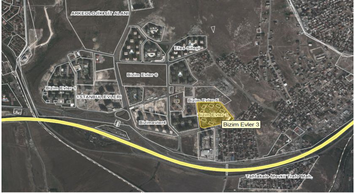
KROKİ-4: TAŞINMAZIN BULUNDUĞU SİTE VE DİĞER SİTELER İÇİNDEKİ KONUMU