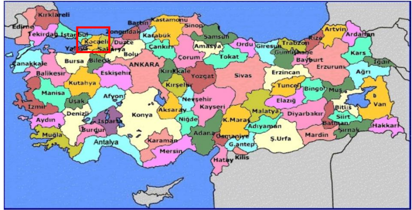
Harita 1 - Kocaeli'nin Konumu

Kocaeli'nin sanayileşmesinde en önemli etken, tüm ulaşım imkanlarına sahip olmasıdır. Kara ve demiryolu ağları ile yapılan taşımacılık özellikle Avrupa ve Ortadoğu'ya yapılmakta olup, limanlar ile yapılan deniz taşımacılığı da önemli bir boyuta ulaşmıştır. İstanbul ve Bursa gibi önemli ticaret ve sanayi merkezlerine yakınlığı, yatırımlar açısından Kocaeli'yi öncelikli kılmaktadır. Kocaeli'nin şehir merkezi İzmit'in İstanbul'a uzaklığı 85 km'dir. İstanbul'un batı yakasında bulunan Atatürk Hava Limanı ve doğusunda faaliyet gösteren hemen yakınındaki Sabiha Gökçen Havalimanı ile dünyaya açılan Kocaeli, Ankara'ya da TEM otoyolu ile bağlıdır. Uluslararası İstanbul Atatürk Havalimanı 97 km. mesafededir. Ayrıca Uluslararası Sabiha Gökçen Havalimanı'na 50 km. mesafededir. 5'i Kamu Limanı (Derince ve Yarımca) ve 35 özel iskele ile deniz ulaşımı imkanları açısından tüm Anadolu'nun en iç noktasındadır.